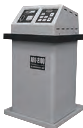
AUR-2100R Electrolytic Silver Recovery System

一体型静止電極の銀回収機。現像機に循環システムとして接続、定着液使用量を75%以上低減可能。