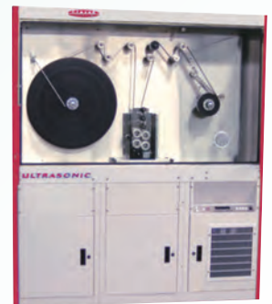
6000 ft. Model