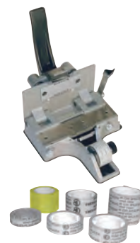
Splicers & Splicing Tapes