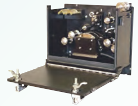
Printer Head for Shrunken Films