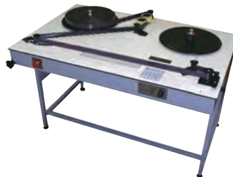
D-Observer Digital Table