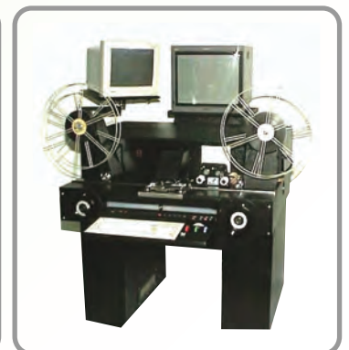
HAZELMASTER Digital Upgrade