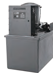
SilverPAC RS/LM-60, RS/LM-90, Dual RS/LM-90