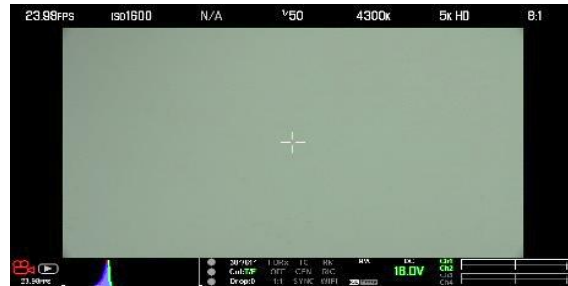
※7 RED 5KHD 32mm