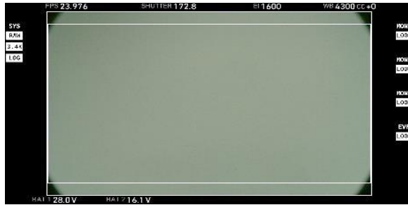
※2 ARRIRAW OG(16:9 Frame Line) 16:9 21mm