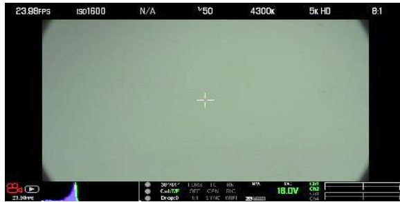
※6 RED 5KHD 25mm