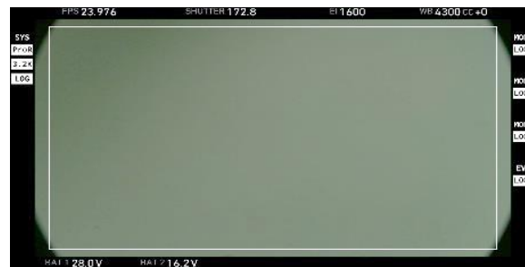
※3 Prores3.2K(16:9 Frame Line) 21mm