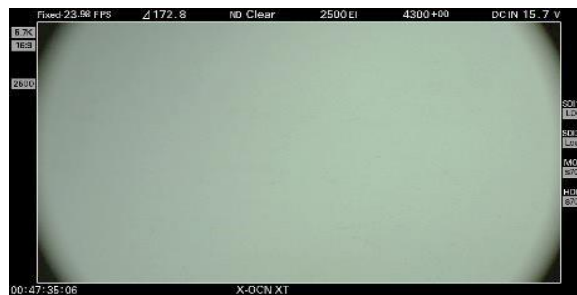
※9 VENICE 5.7K 50mm