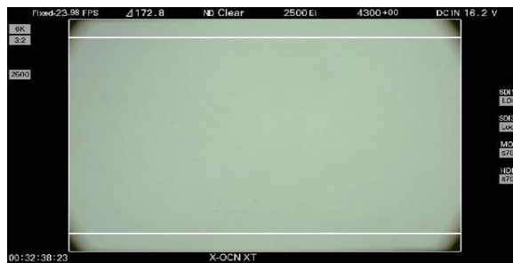
※8 VENICE 6K 3:2 65mm