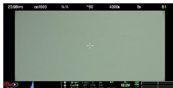
※5 RED 5K 50mm