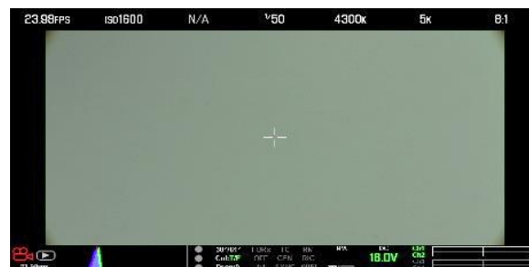
※4 RED 5K 40mm